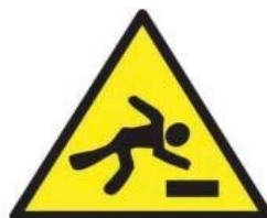
Pericolo di inciampo