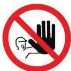
Divieto di accesso alle persone non autorizzate

Segnali di DIVIETO: Vietano un comportamento dal quale potrebbe risultare un pericolo.