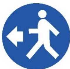
Passaggio obbligatorio per i pedoni

Segnali di PRESCRIZIONE: Obbligano a tenere un comportamento di sicurezza.