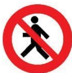
Divieto di transito ai pedoni