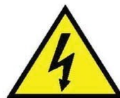
Tensione elettrica infiammabile