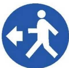
Passaggio obbligatorio per i pedoni

Segnali di PRESCRIZIONE: Obbligano a tenere un comportamento di sicurezza.