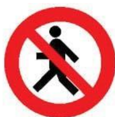
Divieto di transito ai pedoni